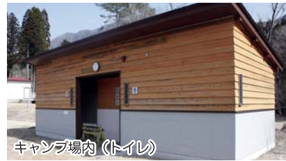
キャンプ場内(トイレ)