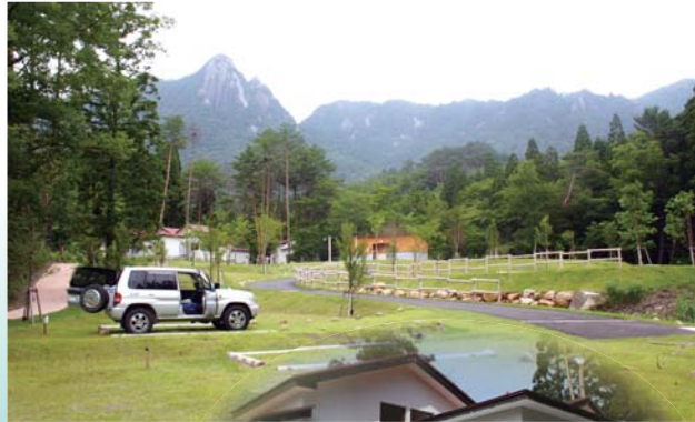
▲オートキャンプ場