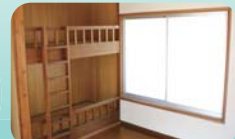
▲バンガロー2段ベット