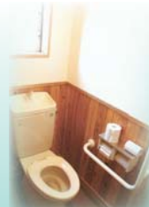
▲バンガロー トイレ