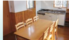
▲バンガローダイニング